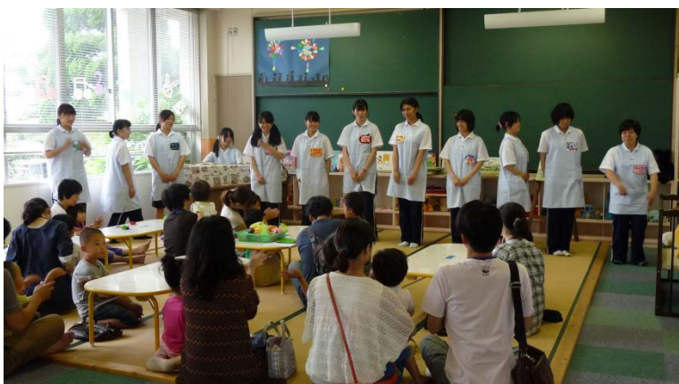
幼児教育科学生スタッフ(1年)のみなさん