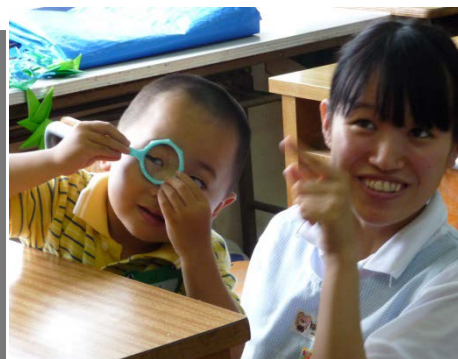
先生も学生スタッフも子どもの視線でコミュニケーション