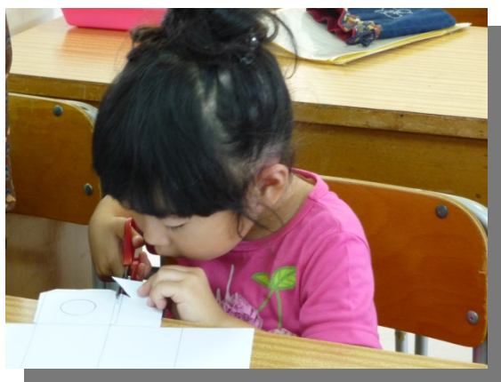
はさみ上手に使えるね